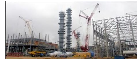
Консервация и ликвидация/ Техническое перевооружение