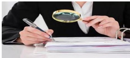
Обоснование безопасности/ Декларации