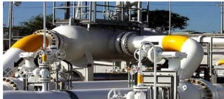
Технические устройства/ Здания и сооружения